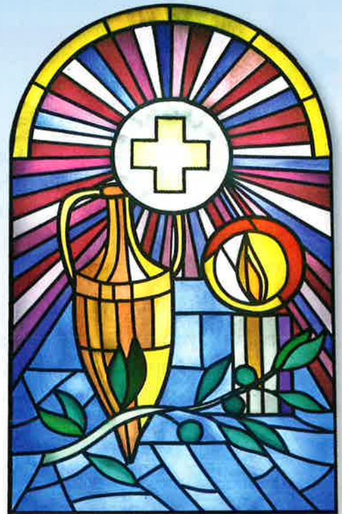
Vitral que muestra el óleo para la Unción de los Enfermos

Durante su vida Jesús demostró una simpatía especial por los enfermos y sanó el dolor de muchas personas. Demuestra tu preocupación por las personas que estén enfermas y ayúdalas consolándolas y haciéndote amigo de ellas.