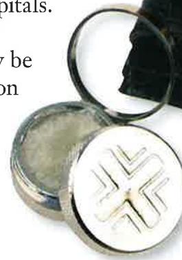
Priest's travel kit with oil for anointing those who are sick