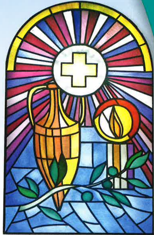
Stained-glass window showing oil for the Anointing of the Sick

During his life Jesus showed special sympathy to those who were sick. He healed the sufferings of many. Show concern for people who are sick and help them by comforting them or befriending them.