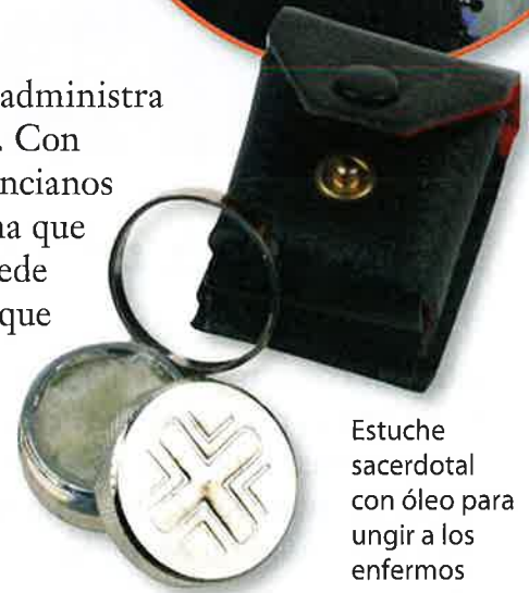
Estuche sacerdotal con óleo para ungir a los enfermos